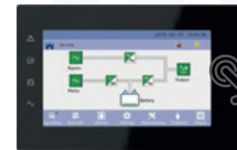
Pantalla táctil HMI 7 pulgadas